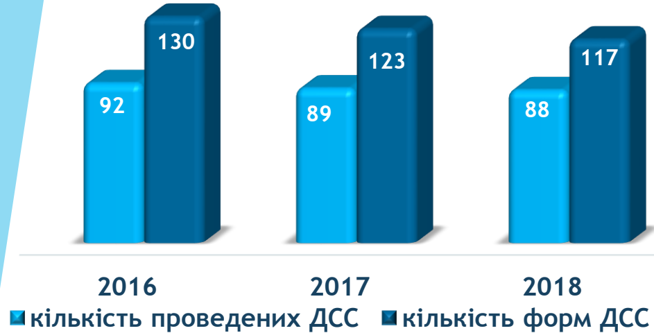
Державні статистичні спостереження (ДСС)