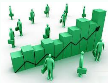
Кількість підприємств за їх розмірами (одиниць)