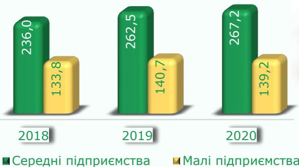
Кількість зайнятих працівників (тис. осіб)

Кількість зайнятих працівників визначається з урахуванням штатних, позаштатних і неоплачуваних (власників, засновників підприємства та членів їх сімей) працівників підприємства